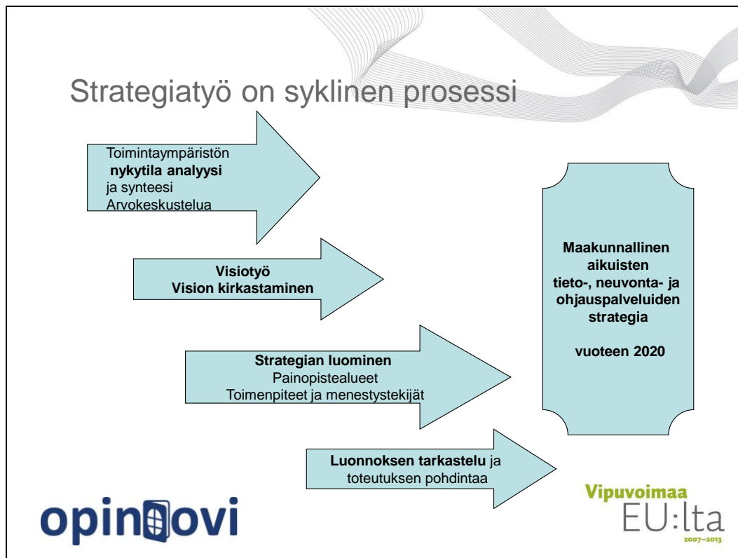
Kuva 1. Strategiaproessin eteneminen

Maakunnallista aikuisten tieto-, neuvonta- ja ohjauspalveluiden strategiaa on valmisteltu Lapin Opin ovi -projektin toimintana. Strategiatyön onnistumisen edellytykseksi nostettiin jo alkuvaiheessa aluehallinnon ja eri hallinnonalan toimijoiden sekä koulutuksenjärjestäjien yhteistyö. Tämän ajatuksen pohjalta kutsuttiin myös edustajat strategiatyöryhmään.